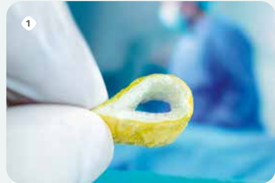
Im trockenen Zustand frei formbar